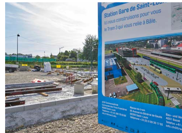
MOBILITE DURABLE : GARE DE SAINT-LOUIS

L'IBA Basel conseil et coordonne l'ensemble des acteurs impliqués dans cette démarche qu'elle a initiée.