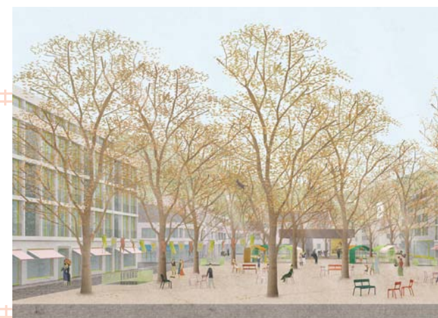
DEVELOPPEMENT URBAIN : GARE DE GRENZACH