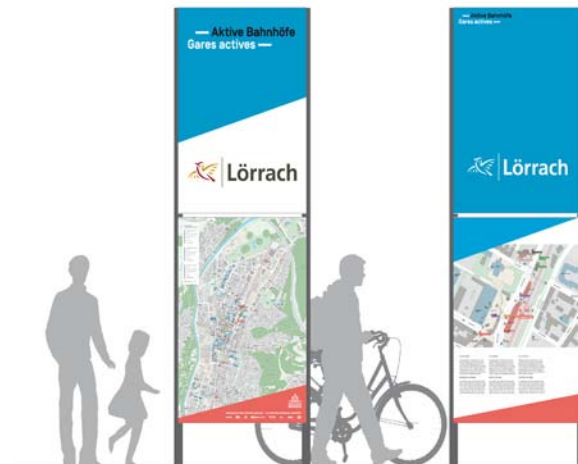
ACTION COMMUNE : SYGNALÉTIQUE TRINATIONALE

Par l'ensemble de leurs actions, ces communes encouragent l'usage du RER trinational de Bâle ; un réseau de transport en commun par rail facilitant quotidiennement le déplacement de milliers d'habitants de la région. Développer l'agglomération autour des stations du RER, c'est assurer à chacun, un accès à l'ensemble des opportunités de l'agglomération trinationale en transport en commun.